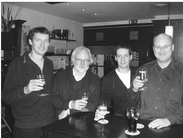
Ruhrigameister 2006: Chat Noir Dortmund